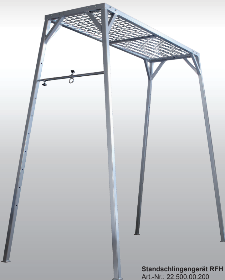
Standeschlingengerät RFH Art.-Nr.: 22.500.00.200