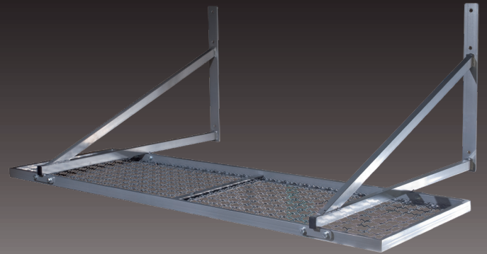
Wandschlingengerät RFH Art.-Nr.: 22.500.00.100